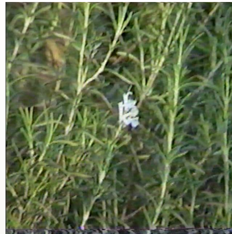
Rosmarinus officinalis romero