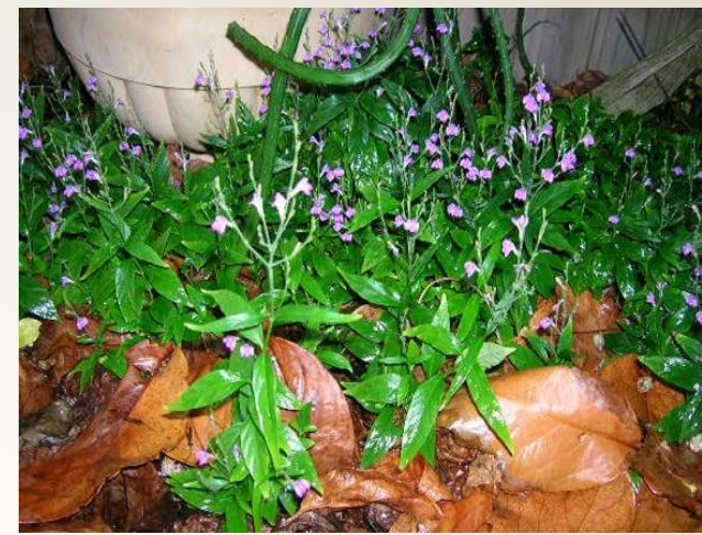
Justicia pectoralis (ramas)