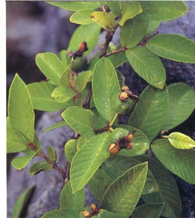
Psidium guajava guayaba