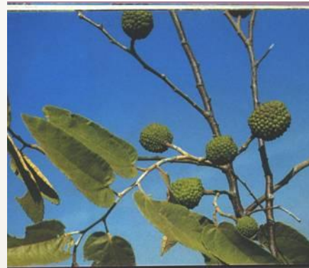
Guazuma ulmifolia guásima