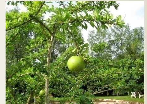
Crescentia cujete güira