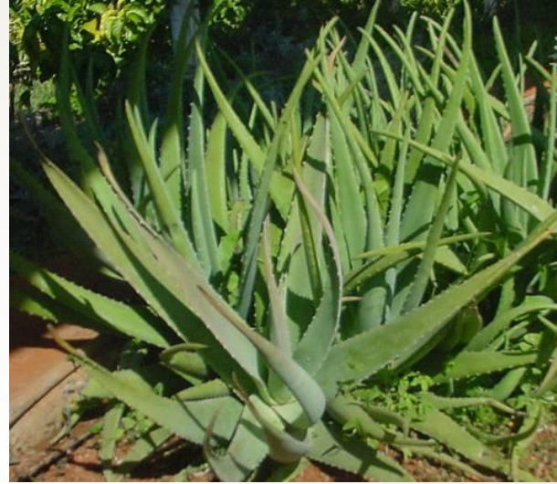
Aloe vera (sábila)