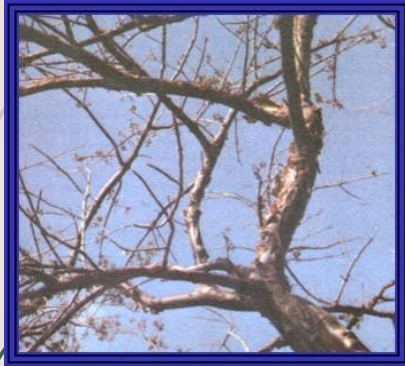
Bursera simaruba almácigo