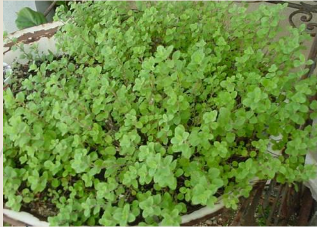
Origanum majorana mejorana