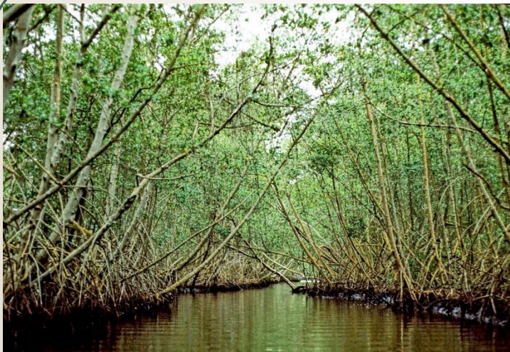
Rhizophora mangle (corteza)

Parte de la planta medicinal que contiene los principios activos