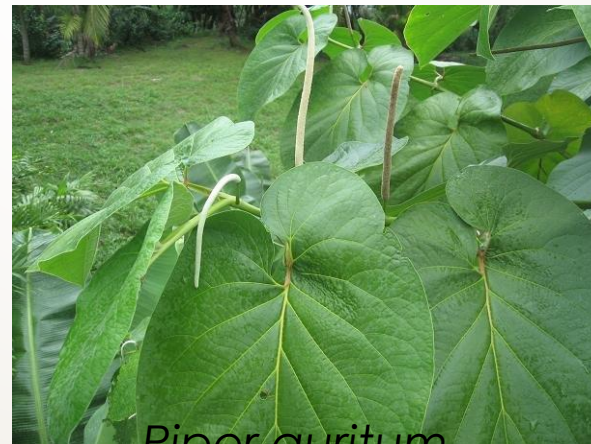
Piper auritum (hojas)