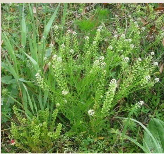
Lepidium virginicum (toda la planta)