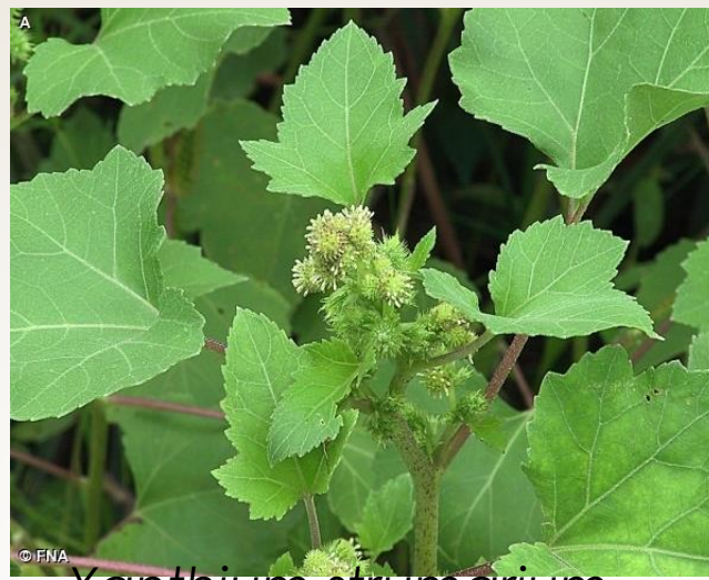
Xanthium strumarium (raíces)