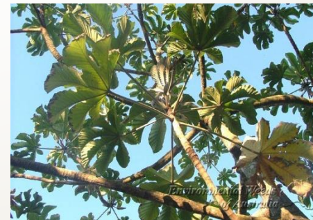
Cecropia peltata yagruma