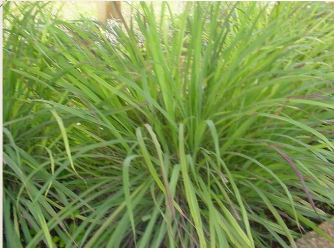
Caña santa ( Cymbopogon citratus ).