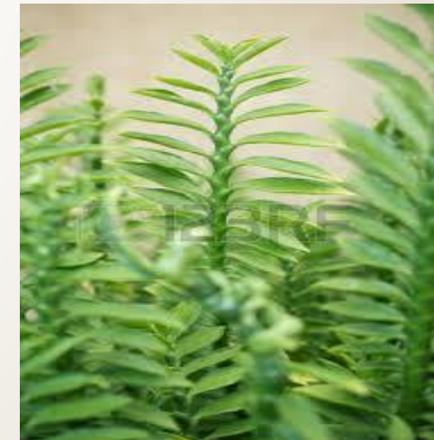
Pedilanthus tithymaloides (tallos)